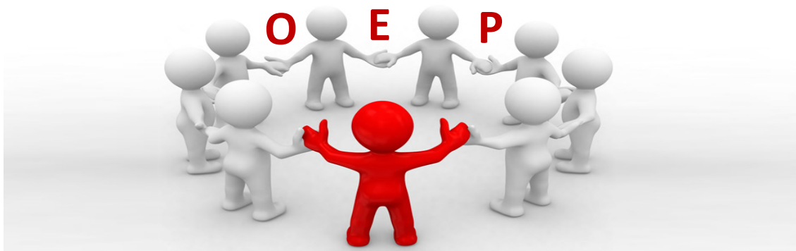
“La comunicación como herramienta de cambio”