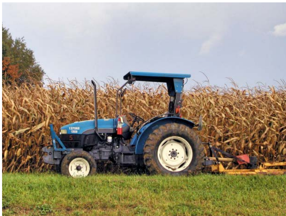
Tractor junto a un maizal.