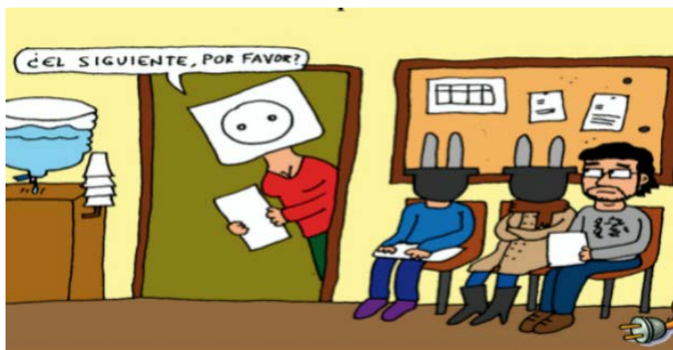
Viñeta contra el enchufismo en la Junta publicada por SITACyL.